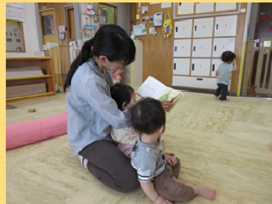
沼袋保育園保育士

沼袋保育園に勤務しています。 入区7年目になります！ 去年は、年長クラスを持たせて頂きました。 現在0歳児クラスを担当しています。